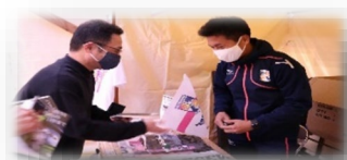
地域イベント参加